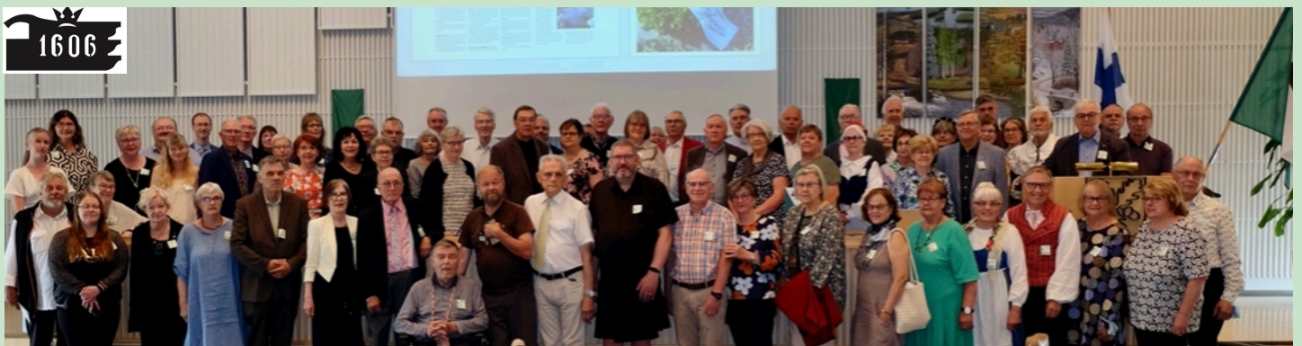
Sukukokous ja -juhla järjestetään kolmen vuoden välein. Kuva vuoden 2022

utm_medium=social&utm_campaign=areena-ios-share