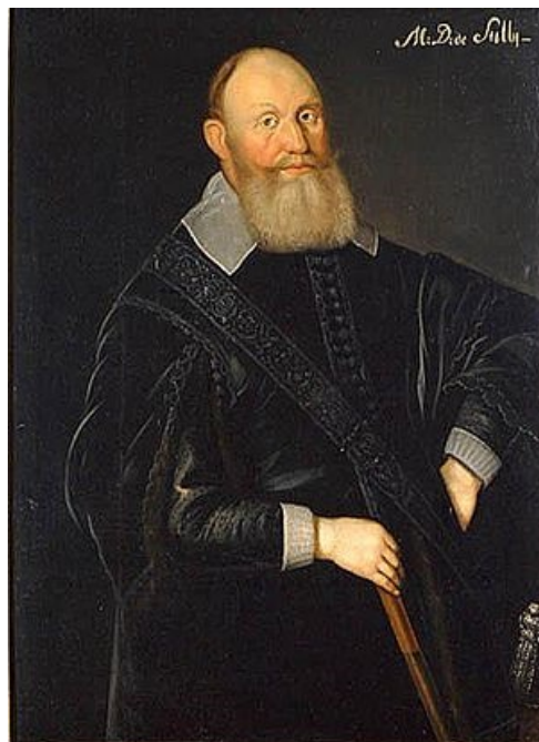
CARL CARLSSON GYLLENHIELM (1574-1650)